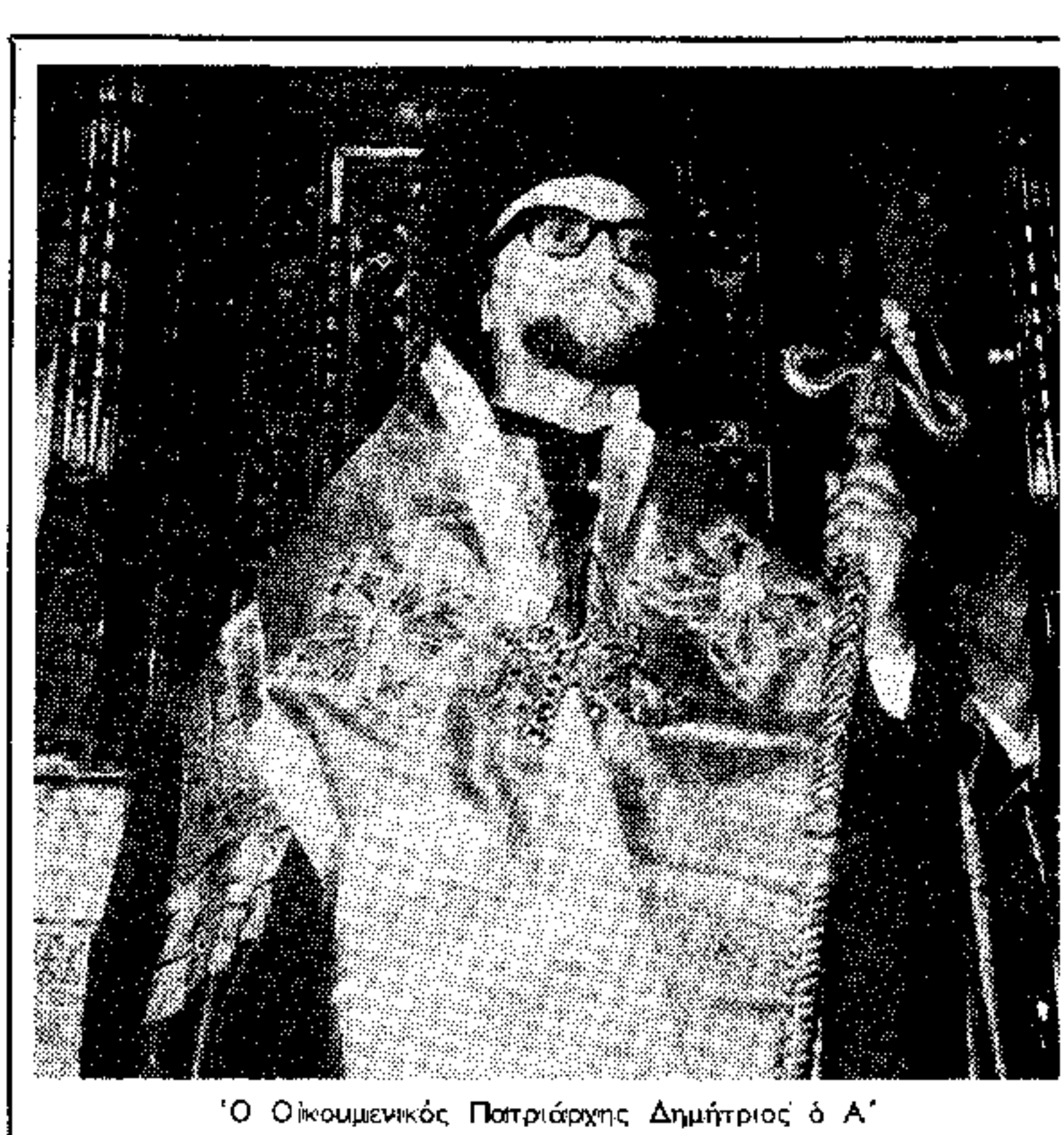
Ο Οικουμενικός Πατριάρχης Δημήτριος Α΄